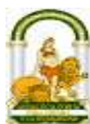
JUNTA DE ANDALUCÍA