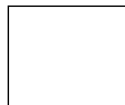
CONSELL GENERAL DE PROCURADORS