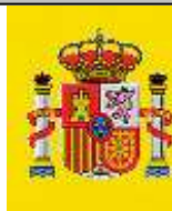
FISCALIA GENERAL DE L'ESTAT