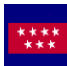
COMUNIDAD DE MADRID